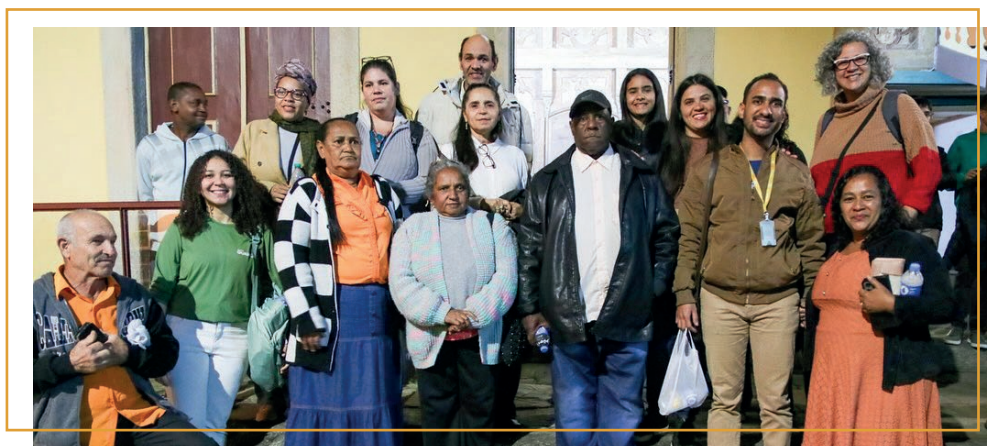
Pessoas atingidas no espetáculo teatral "Zona de Sacrifício" na Casa da Ópera

Como exemplo do diálogo mencionado acima, cita-se a participação da Comissão de Pessoas Atingidas no espetáculo "Zona de Sacrifício", na Casa da Ópera em Ouro Preto. A atividade foi parte da programação do 7º Encontro Regional por um Novo Modelo de Mineração e da 7ª Jornada Universitária de Debate na Mineração, organizados por entidades ligadas à UFOP.