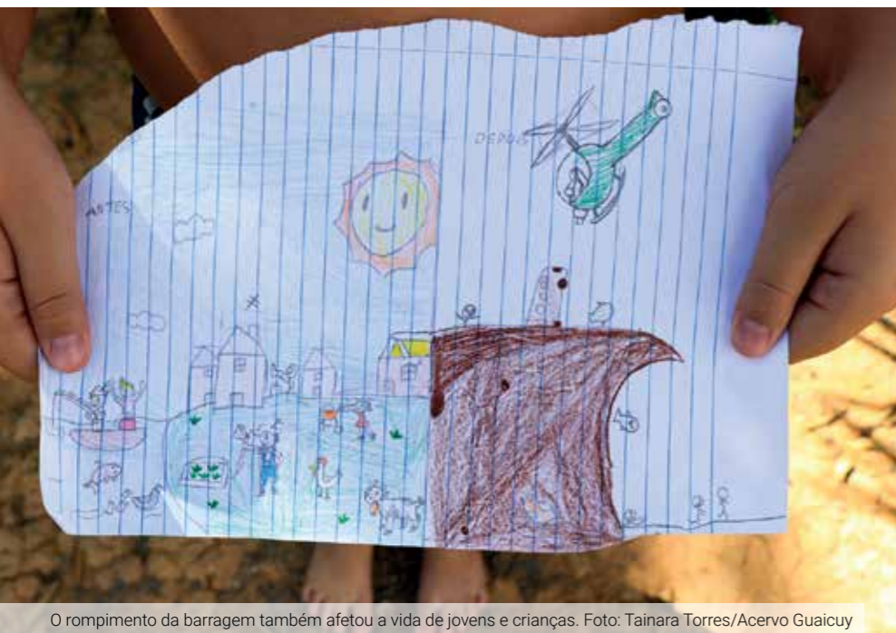
O rompimento da barragem também afetou a vida de jovens e crianças.