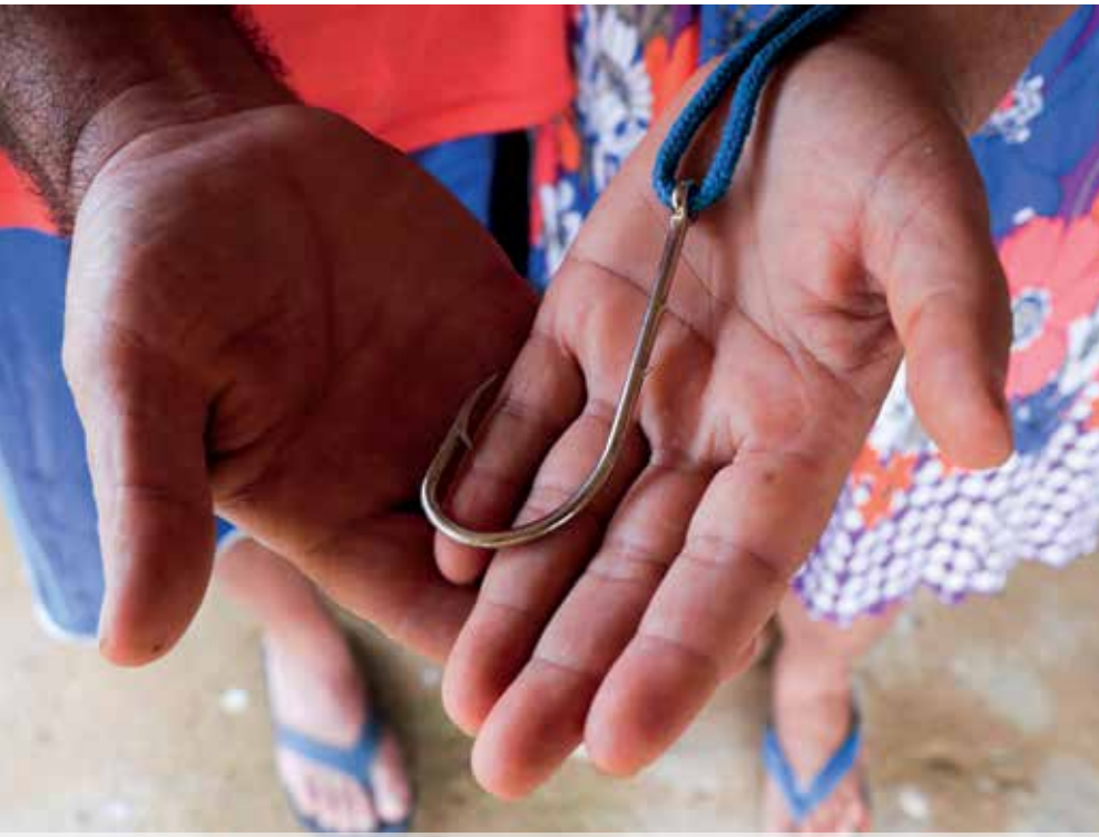
Nas mãos do casal, o anzol usado para a pescaria do peixe conhecido como surubim