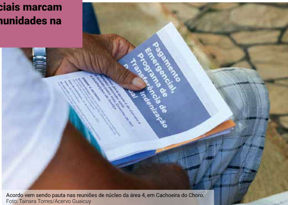
Acordo vem sendo pauta nas reuniões de núcleo da área 4, em Cachoeira do Choro.