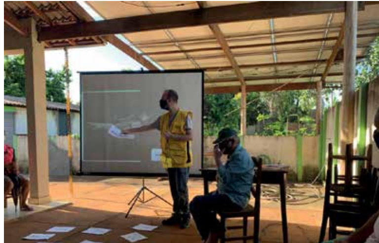
Comunidades em luta pela reparação integral.

O Programa de Transferência de Renda (PTR) terá o valor total de R$ 4,4 bilhões e irá substituir o atual Pagamento Emergencial. No entanto, os critérios serão diferentes e quem não recebia o Emergencial poderá ser incluído no novo programa.