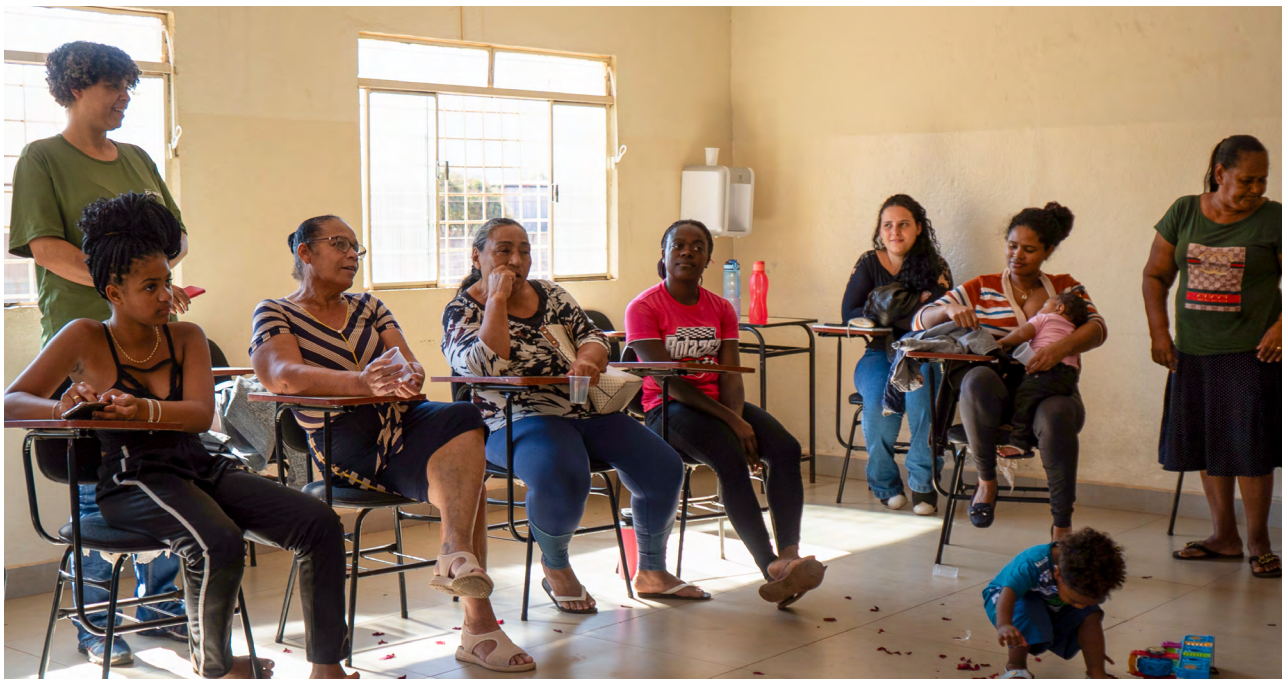
Reunião do Canal das Moças

Em parceria com o Centro de Referência de Assistência Social (CRAS) de Antônio Pereira, a equipe da ATI desenvolve atividades junto às mulheres do distrito dentro do grupo Canal das Moças , que promove cidadania e geração de renda para mulheres atingidas pela Vale no distrito.