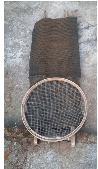
Equipamentos utilizados no garimpo artesanal