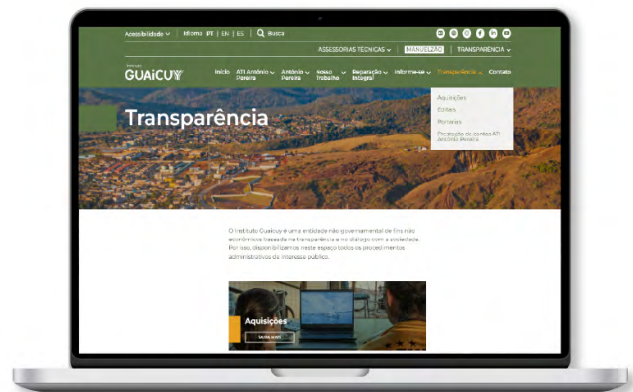
Página da Transparência no site

Os relatórios de dezembro de 2023, janeiro 2024, fevereiro 2024, março 2024, abril 2024 e maio 2024 foram diagramados e publicados em versões digitais (pdf e leitura no próprio site) para, de forma especial, ampliar o acesso de todas as pessoas atingidas de Antônio Pereira, além dos órgãos públicos, Universidades, GEPSA, pesquisadores, sociedade civil, trabalhadoras e trabalhadores do Instituto Guaicuy.