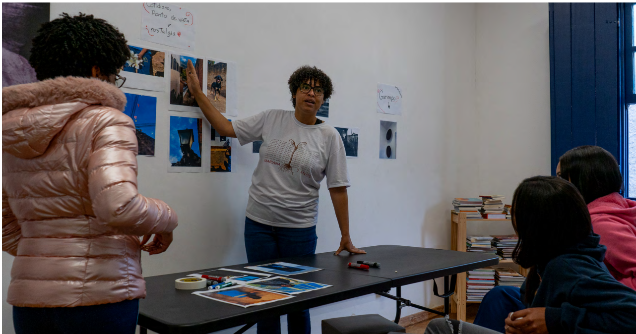
Debate sobre curadoria durante oficina com os estudantes da Escola Estadual Antônio Pereira

Realizado com os adolescentes do Ensino Médio da Escola Estadual Antônio Pereira, de maio a agosto de 2024, o projeto Direitos Humanos e Comunicação Popular foi desenvolvido pela equipe de Direitos e Participação Social, responsável pelas atividades com o primeiro ano; e pela equipe de Comunicação Social, responsável por desenvolver as atividades com as turmas do 2º e 3º ano.