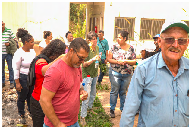
Intercâmbio dos Quintais Produtivos