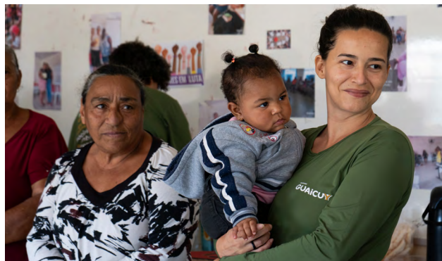
Momento de diálogos durante encontro do Canal das Moças

Além de promover rodas de conversas e dinâmicas sobre os impactos da mineração na vida das mulheres, os encontros se tornaram um espaço de acolhimento coletivo. Em outubro, o grupo fará um intercâmbio de saberes com pessoas de outro distrito com o objetivo de fortalecer a identidade comunitária.