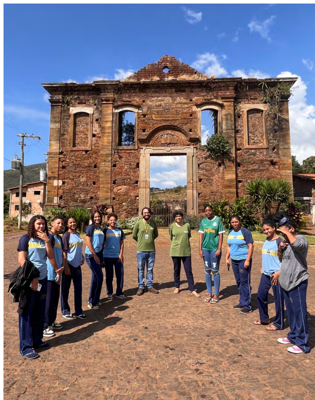
Momento de atividade prática de fotografia pelo distrito

As oficinas com os adolescentes são voltados para a produção de conteúdo artístico comunicacional de interesse das/os estudantes, que escolheram como ferramenta de trabalho a fotografia. A base político-pedagógica é a comunicação popular na defesa de direitos humanos.