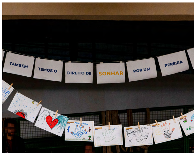
Alguns trabalhos da ciranda expostos durante a reunião

É importante salientar que a ampla participação da comunidade na reunião, resultado da mobilização social e confiança estabelecida junto às pessoas atingidas, legitimou a revitalização da Comissão de Pessoas Atingidas de Antônio Pereira, que hoje também é representativa, pois contam com participantes dos 5 Núcleos Comunitários organizados pela ATI. Núcleo Comunitário é uma metodologia de organização territorial desenvolvida e aplicada pelo Instituto Guaicuy, citada inclusive na última petição do Ministério Público sobre a atuação e tempo de permanência da ATI no território. Confira o documento completo.