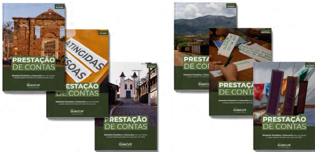
Capas dos relatórios publicados no site

No dia 9 de agosto, ATI divulgou, no boletim semanal enviado à comunidade de Antônio Pereira, as novidades na página de Transparência e Prestação de Contas no site do Guaicuy. A fim de fortalecer o pilar da transparência do trabalho do Guaicuy junto à comunidade, foi realizada a atualização de todas as páginas da ATI Antônio Pereira, com revisões na página de Transparência e com o lançamento da Prestação de Contas Digital.