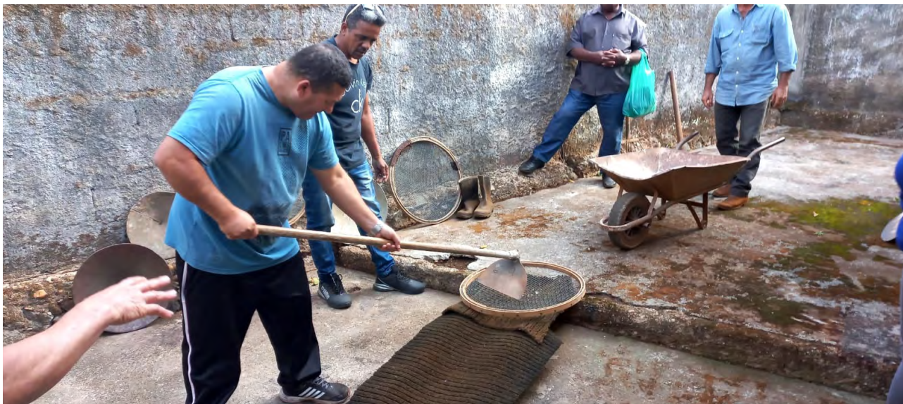
Comunidade garimpeira demonstra aos promotores e técnicos do Ministério Público de Minas Gerais como o garimpo é realizado no distrito, de forma artesanal e sem a utilização de mercúrio

Também como resultado da conversa do dia 16 de julho entre Guaicuy e MP, no dia 30 de julho, os representantes do Ministério Público de Minas Gerais se reuniram com as garimpeiras e garimpeiros tradicionais de Antônio Pereira.