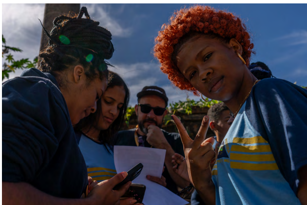
Oficina com jovens

Direitos Humanos e Comunicação Popular (com crianças e adolescentes), Quintais Produtivos e o grupo de mulheres no Canal das Moças foram os três grupos temáticos que impulsionaram pautas positivas na comunidade nos meses de junho, julho e agosto. Além disso, os encontros nesses grupos promoveram fortalecimento comunitários, laços afetivos, escuta, acolhimento e reconhecimento de danos causados pela mineração predatória do território.