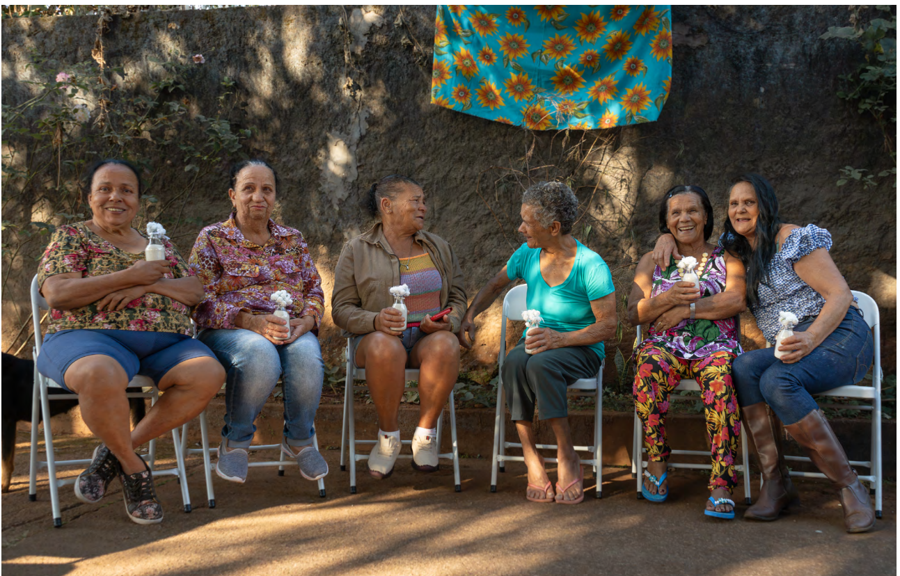
Reunião com as Benzedeadas no escritório do Instituto Guaicuy

De geração em geração, as benzedeadas são sinônimo de fé , cura, saúde e sabedoria em sintonia com a natureza. Pensando na tradicionalidade deste grupo específico dentro do contexto da reparação pelos danos causados pelo risco de rompimento e obras de descaracterização da Barragem Doutor, a equipe da ATI organizou o primeiro encontro de benzedeadas de Antônio Pereira, no dia 13 de julho, no escritório do Guaicuy no distrito, e reuniu cinco das 14 benzedeadas mapeadas até o momento.