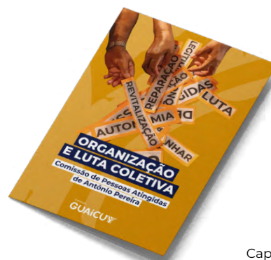
Capa da cartilha

Em 20 de junho, o Guaicuy lançou um importante instrumento de luta e organização para a Comissão, a cartilha “ Organização e luta coletiva ”. O material, que está disponível na versão on-line e impressa (para distribuição na comunidade), destaca o papel da Comissão como uma das mais importantes instâncias de luta por uma reparação integral.