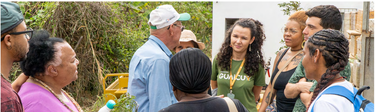
Momento de diálogos durante o intercâmbio

julho - Intercâmbio de saberes e experiências em Paracatu de Baixo.