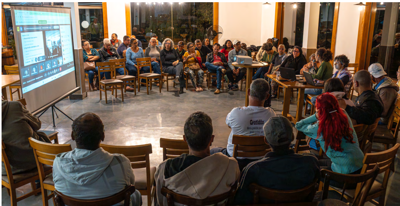
1ª Reunião da Comissão de Pessoas Atingidas de Antônio Pereira Revitalizada

A revitalização da Comissão de Pessoas Atingidas é a entrega mais significativa da ATI Antônio Pereira neste ano de 2024. Existente desde 2019, a Comissão é a voz das pessoas atingidas diante da Vale, da justiça, do Ministério Público de Minas Gerais e de outras entidades.