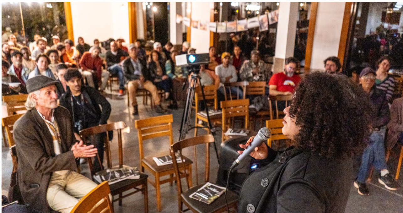
Lançamento do documentário Quanto vale o que não tem preço? em Antônio Pereira

Após seis meses de produção, entrevistas e montagem, no dia 3 de julho de 2024, a equipe do Guaicuy na ATI do distrito de Antônio Pereira, Ouro Preto/MG, lançou o documentário “Quanto vale o que não tem preço?”. O filme também foi traduzido para a versão em inglês com o título The Cost of Vale.