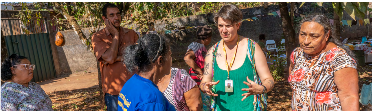
Momento de troca de saberes durante a oficina

agosto - Oficina de compostagem/ adubo - transformando lixo em luxo!