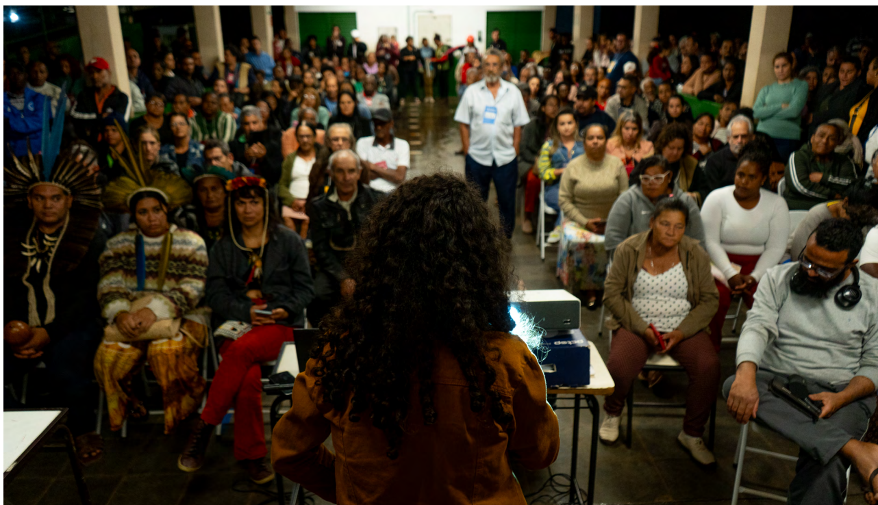
Reunião da Comissão de Pessoas Atingidas de Antônio Pereira e do Guaicuy com o MPMG e a CAO-Cimos