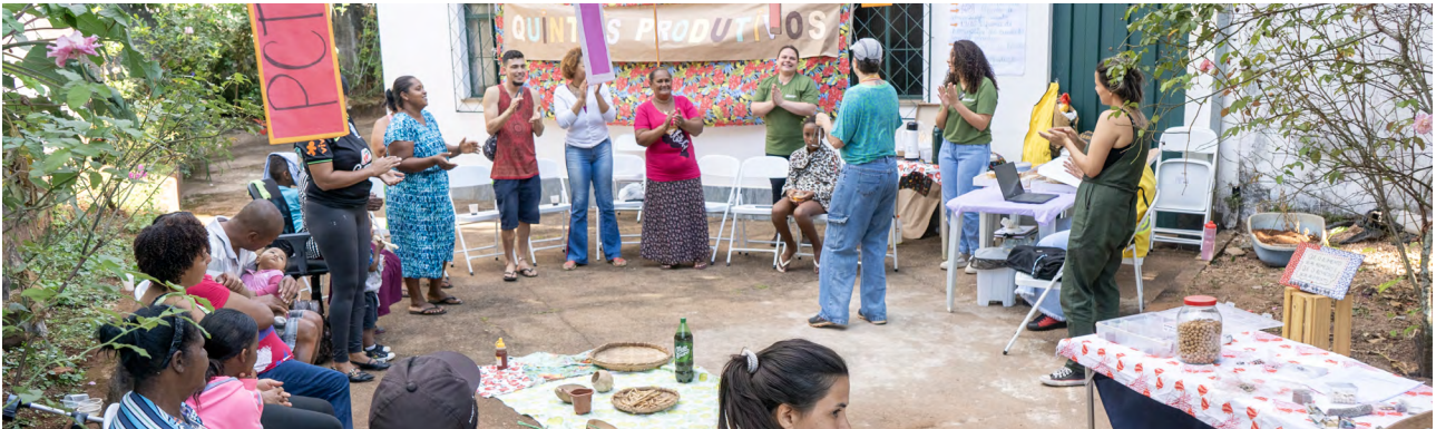
Momento de mística durante o encontro do GT Quintais Produtivos